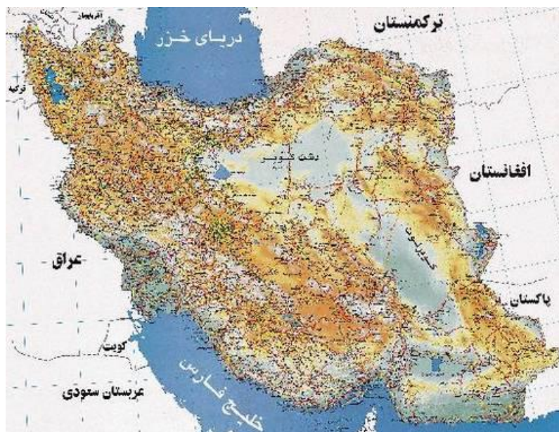
شکل ۲-۳ نقشه ایران

باید تا حد امکان از به‌کاربردن صفحه‌های بزرگ مانند نقشه‌ها در پایان‌نامه خودداری شود و آن‌ها را از طریق رونوشت‌های (فتوکپی‌های) مخصوص در اندازه تعیین شده تهیه کرد. در صورت لزوم باید به دقت صفحه مورد نظر را داخل پایان‌نامه طوری تا نمود که لبه آن از دیگر صفحه‌ها بیرون نزنند.