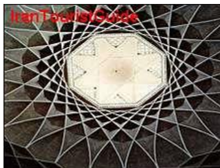
شکل ۲-۲ یک اثر معماری

گاهی برای نشان دادن یک دستگاه، شیء یا رویداد، تنها از عکس می‌توان کمک گرفت. هرگاه جزء خاصی از عکس مورد نظر است، باید به گونه‌ای تهیه شود که اجزای فرعی چشمگیرتر از جزء مورد نظر نباشد (شکل ۲-۱).